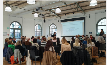
Vernetzungstreffen TANDEM Sachsen in Chemnitz, Bild: Damaris Plietzsch/BIP

ein spannendes Podiumsgespräch zum Thema „Vermittlung Langzeitarbeitslose – Was wirkt?“ auf dem Programm, gefolgt vom Netzwerkforum am Nachmittag, das Raum für Austausch, Bedarfsabgleich und neue Kooperationen bot. Viele neue