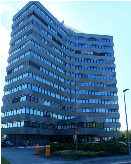
Grone Niederlassung in Chemnitz

Mit der Übernahme der ehemaligen TÜV Rheinland Akademie Standorte (Görlitz, Chemnitz, Gera und Erfurt) und der damit einhergehenden Weiterentwicklung von Bildungsstandorten in Thüringen und Sachsen baut Grone seine Präsenz im Freistaat Sachsen gezielt aus und stärkt insbesondere den Standort Chemnitz. Ziel ist es, ein leistungsfähiges Netzwerk moderner Trainingszentren zu schaffen, das den Anforderungen eines sich wandelnden Arbeitsmarktes gerecht wird und nachhaltige Perspektiven für Fachkräfte eröffnet.